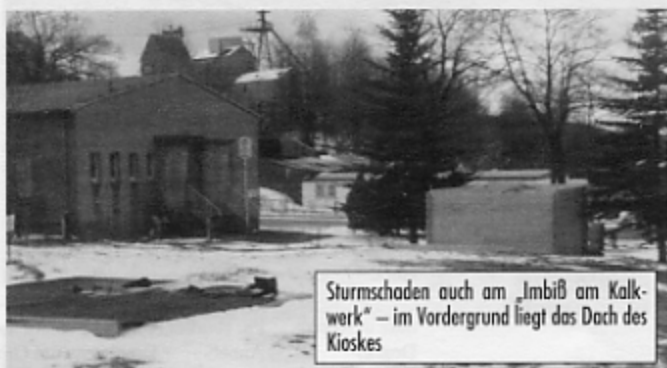
Sturmschaden auch am „Imbiß am Kalkwerk“ – im Vordergrund liegt das Dach des Kioskes