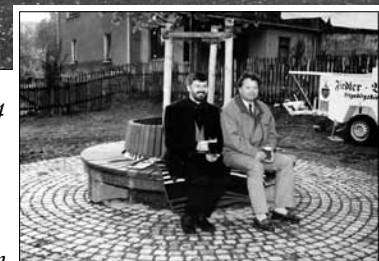
Vor 20 Jahren