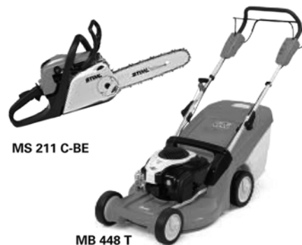
MS 211 C-BE