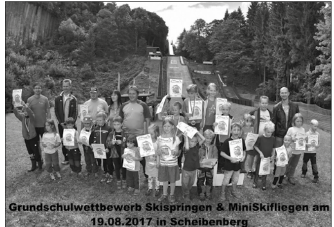
Grundschulwettbewerb Skispringen & MiniSkifliegen am 19.08.2017 in Scheibenberg

Danke allen, die fleißig zum Gelingen des Tages beigetragen haben.