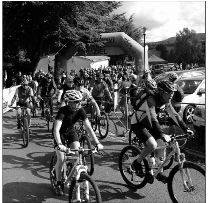
Volksfeststimmung am dritten Augustsonntag auf dem Cunersdorfer Waldfestgelände während des Starts zum Annaberger-Landring-Radeln.