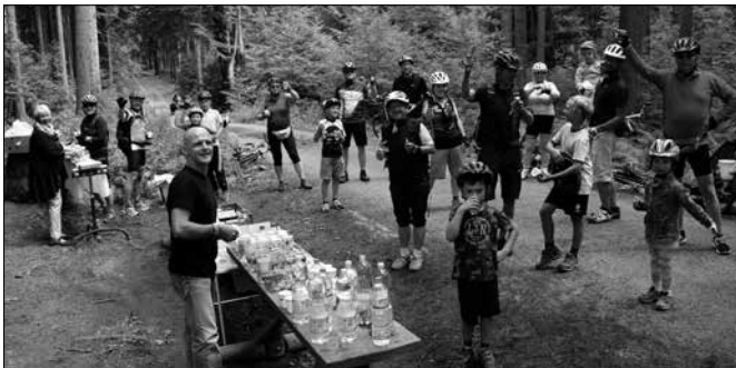
Die Teilnehmer aller drei Touren hatten an einer Schutzhütte im Zulaufbereich der Talsperre Crazahl die Möglichkeit, bei einer Rast „aufzutanken“.

Trotz der vielen zu absolvierenden Höhenmeter, welche jede Tour während des Streifzuges durch die Region auf ihre Art zu bieten hatte, hatten die Fahrerinnen und Fahrer aus nah und fern nach ihrer kräftezehrenden Tour die Möglichkeit, Hunger und Durst bei den fleißigen Cunersdorfer Vereinen zu stillen. Das Radelfest mit Informationsständen von Partnern aus der Region bot zudem für Tourteilnehmer nach der Zieleinfahrt die Möglichkeit, neben der Teilnehmerurkunde auch einen der Preise der Verlosung des Vereines Annaberger Land mit nach Hause zu nehmen. An dieser Stelle freuen sich Veranstalter und Teilnehmer bereits auf die 14. Auflage des regionalen Radevents, welche im kommenden Jahr erneut am dritten Sonntag im August über die Bühne gehen soll. Der Austragungsort hierfür wird zu gegebener Zeit noch bekanntgegeben. Ein ganz herzlicher Dank gilt ausdrücklich allen Teilnehmern, der Großen Kreisstadt Annaberg-Buchholz, den Verantwortlichen des Jubiläums „650 Jahre Cunersdorf“ mit allen Vereinen und Akteuren vor Ort sowie Partnern und Unterstützern des Annaberger-Landring-Radelns 2017 für ihre wertvolle Mitwirkung und den Zuspruch, denn ohne dieses Engagement wäre eine solche Veranstaltung nicht denkbar. Veranstalter und Organisatoren danken weiterhin dem Staatsbetrieb Sachsenforst, der Straßenverkehrsbehörde des Erzgebirgskreises, dem Polizeirevier Annaberg sowie allen Ämtern in den Kommunen zur Gewährung der Durchführung des „Annaberger-Landring-Radelns“. Sport frei!