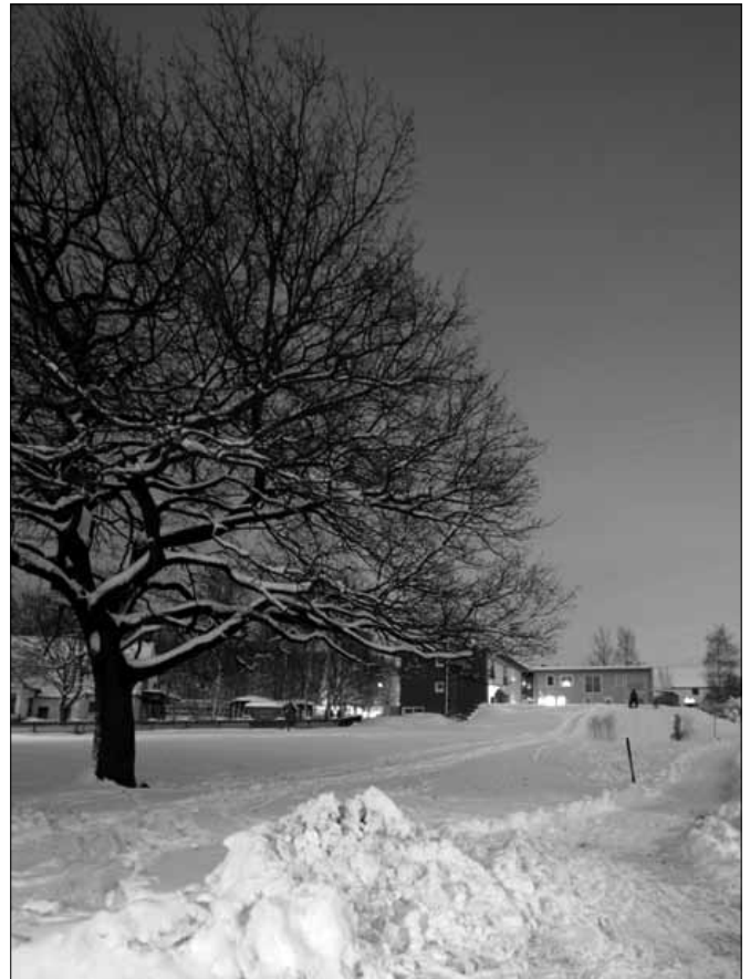
Winterimpression vom Eichenweg

Demokratie ist etwas sehr Wertvolles! Sie immer wieder neu zu praktizieren ist wichtig und notwendig. Selbstverständlich braucht Demokratie vor allem auch Mut zur Anwendung. Der Scheibenger Stadtrat und die Scheibenger Bürgerschaft haben am 20. Januar 2013 dies wieder einmal bemerkenswert gemeistert. Die friedliche Revolution von 1989 trägt hier in unserer Stadt weiter Früchte.