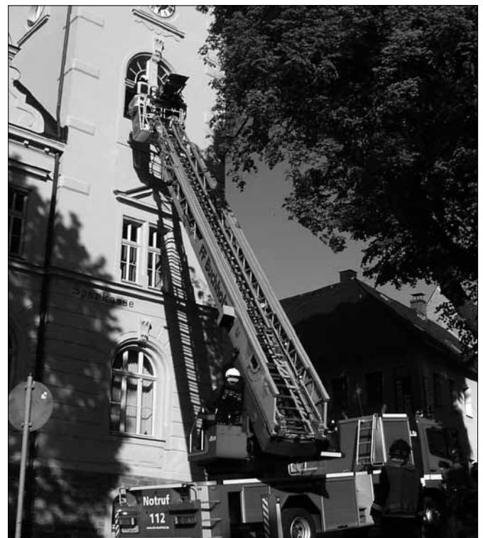
Feuerwehrschauübung am 25. Mai 2012 als Festauftakt

männern. Auch an dieser Stelle nochmals ein herzliches Dankeschön für diesen wichtigen Dienst. Für jeden in der Stadt sollte es deshalb eine Selbstverständlichkeit sein, unsere Feuerwehren zu unterstützen. Schon in der nächsten Minute können wir in den Geschäften, Betrieben, Wohnhäusern oder in den öffentlichen Gebäuden Betroffene sein und die Hilfe der Feuerwehr brauchen. Jeder kann betroffen sein!