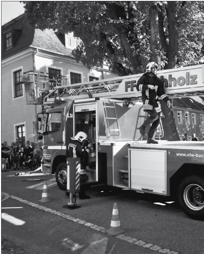
Feuerwehrschauübung am 25. Mai 2012

Ein schöneres Dankeschön und noch ein so angenehmes dazu kann es für die Kameradinnen und Kameraden der Freiwilligen Feuerwehren nicht geben. Nutzen Sie an diesem Augustwochenende das vielfältige Festprogramm der Scheibenberger Feuerwehr. Für jeden, ob jung oder älter, ist etwas dabei. Informieren Sie sich rechtzeitig über den Programmverlauf und kochen Sie einmal nicht zu Hause, sondern lassen Sie sich die Angebote der Freiwilligen Feuerwehr schmecken.