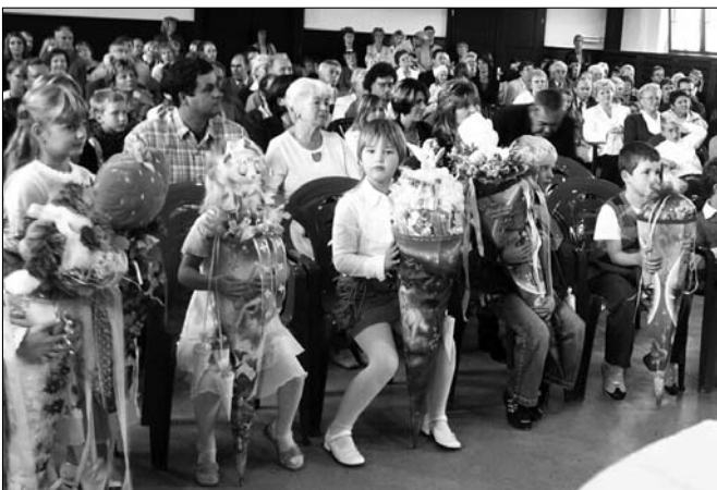
Einschulung in die Christian-Lehmann-Grundschule Scheibenberg 2007

Bisher ist leider die im Rahmen der Verwaltungsgemeinschaft Scheibenberg-Schlettau ins Auge gefasste, gemeinsame Grundschule nicht vorangekommen. Daher müssen wir für Scheibenberg weiter nach einer dauerhaften Lösung suchen.