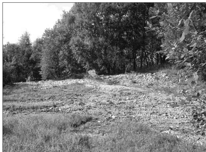
Vom östlichen Mast der Förderanlage ist nichts mehr zu sehen.

Die unvollständige Beschilderung unserer Dorfstraße gab Rettungsdiensten schon Anlass zur Beschwerde. Der Ortschaftsrat wird bezüglich der Beschilderung ein Konzept erarbeiten und es dem Stadtrat zur Genehmigung vorlegen.