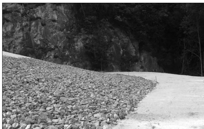
Das Restloch vom Kalkwerk fertig verfüllt.

Die Stilllegung des Kalkwerkes schreitet weiter voran. Sicher waren viele überrascht, als im August plötzlich die Krananlage demontiert worden war. Wer bei einem Spaziergang dort des Weges kommt, kann nur noch staunen, mit wie viel Tonnen Erde das vormals riesige Loch verfüllt wurde. Noch ist nicht entschieden, wie das Areal des Kalkwerkes nachgenutzt werden soll.