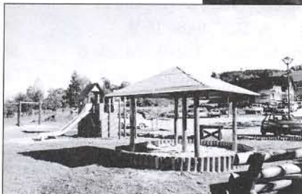
Spielplatz „Am Regenbogen“ in seiner ursprünglichen Ausstattung