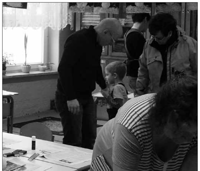
Die Schüler und Lehrerinnen der Grundschule