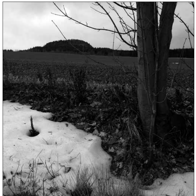
Der Scheibenberg im Dezember 2013

Das Jahr 2014 stellt uns vor eine wichtige und außergewöhnliche Entscheidung. Die zurückgehenden Einwohnerzahlen in unserer Region fordern ein überlegtes Handeln mit Blick auf zukünftige Gemeindestrukturen. Hinzu kommt das Drängen der Staatsregierung auf größere Gemeinden im Freistaat Sachsen. Der Bürgerscheid des vergangenen Jahres hat den Weg für eine freiwillige Gemeindefusion in Scheibenberg freigemacht. Damit ist zum einen die Aufgabe der Selbstständigkeit der Stadt Scheibenberg verbunden, zum anderen ist dieser Weg eine riesige Chance für eine starke neue Stadt, einen gemeinsamen Neubeginn. Wenn dabei alle auf diesen gemeinsamen Weg mitgenommen werden, dann bin ich überzeugt, dass es ein gutes Ergebnis geben wird. Der Zusammenschluss Oberscheibe – Scheibenberg 1994 ist das beste Beispiel dafür. In den nächsten Wochen und Monaten werden wichtige „Weichen“ für die Zukunft einer ganzen Region gestellt. Alle Beteiligten sollten sich hierbei ihrer Verantwortung bewusst werden und wohlüberlegte Entscheidungen fällen. Dazu wünsche ich allen Gesundheit, Kraft, Ausdauer, Zielstrebigkeit und Gottes Segen.