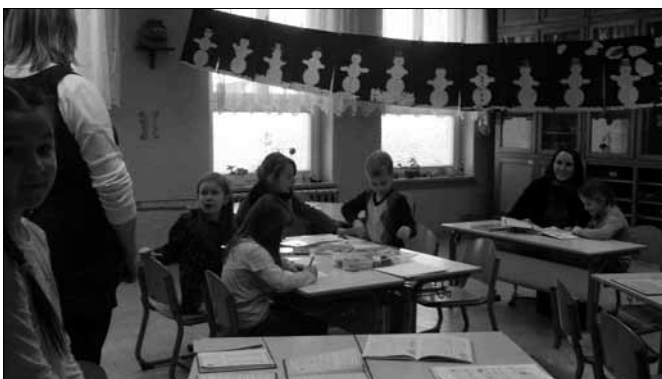
Die Schüler und Lehrerinnen der Grundschule