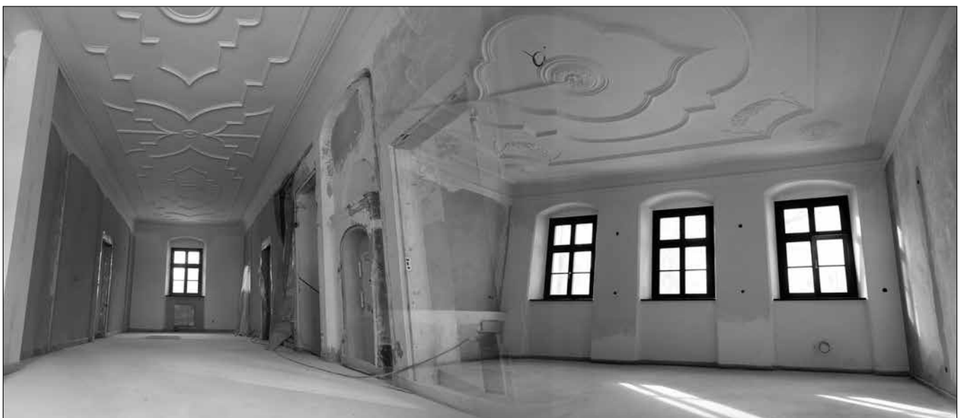
Sanierung denkmalgeschütztes Gebäude Markt 4

Im Mai 2018 wurde durch den Stadtrat die Auftragsvergabe für die Erstellung eines Brandschutzkonzeptes für die Christian-Lehmann-Oberschule beschlossen. Dieses wurde in der Folge angefertigt und es zeigt bestehende Brandschutzmängel auf. In der vergangenen Sitzung des Stadtrates am 18. März 2019 wurde beschlossen, dieses Brandschutzkonzept als Bauantrag bei der Unteren Bauaufsichtsbehörde einzureichen. Nachdem die Prüfung durch einen Prüfsachverständigen erfolgt ist und eine Baugenehmigung erteilt wurde, müssen die Maßnahmen zur Behebung der Mängel umgesetzt werden. Für den ersten Bauabschnitt zur Umsetzung des Brandschutzkonzeptes wurden bereits Fördermittel im Programm „VwV Invest Schule“ in Höhe von 75 % zugesagt. Das bedeutet, dass für diesen ersten Schritt ca. 80.000 Euro investiert werden können. Für die weiteren Bauabschnitte werden zusätzliche Fördermittel benötigt, die durch die Stadt beantragt werden.