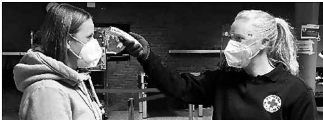
Einlasskontrolle vor der Blutspende mit Temperaturmessung

Der DRK-Blutspendedienst Nord-Ost hat bereits seit dem Frühjahr 2020 zusätzlich zu dem üblicherweise bestehenden hohen Hygienestandard auf seinen Spendeterminen weitere Schutzmaßnahmen eingeführt. Im Rahmen des Infektionsschutzes leisten sie einen wesentlichen Beitrag zu Sicherheit und Schutz aller auf den Blutspendeterminen anwesenden Personen - SpenderInnen, ehrenamtliche HelferInnen und DRK-MitarbeiterInnen.