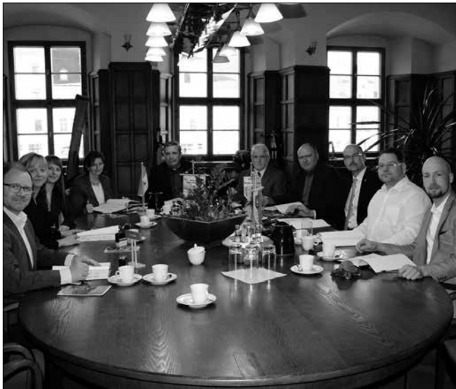
Unterzeichnung der Vereinbarung zum Weiterbetrieb der Erzgebirgischen Aussichtsbahn im Jahre 2017 am 27. März 2017 in Annaberg-Buchholz durch die Projektpartner.

Kurzentschlossene können wie gewohnt Fahrkarten auch am Fahrttag beim Zugpersonal vor Ort und ohne Aufpreis erwerben.