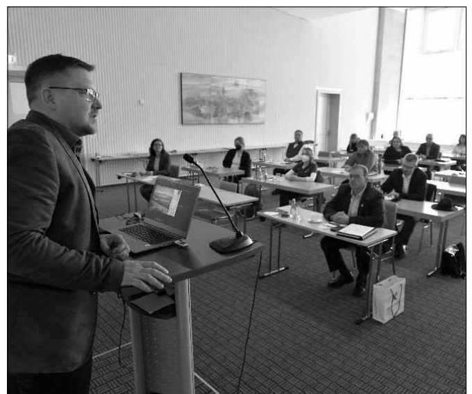
Welterbe Regionalkonferenz am 13. April 2022 in Freiberg

Ansprechpartner: Kristin Hängekorb haengekorb@montanregion-erzgebirge.de 03733 145352 oder 03731 4196102