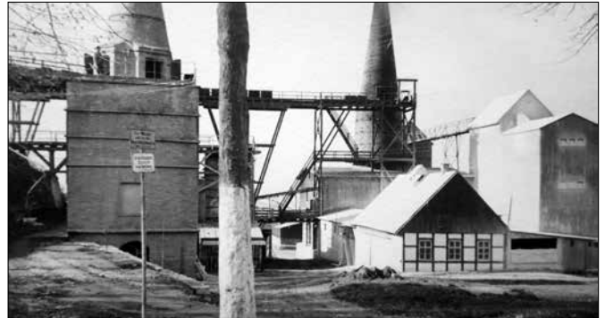
Kalkwerk Oberscheibe im Jahr 1934

Sie hatte ihren Hauptsitz im noch einzigen Bergbau betreibenden Betrieb, dem Kalkwerk Oberscheibe. Da keine schriftlichen Unterlagen über den Knappschaftsverein auffindbar sind, muss angenommen werden, dass diese sich in der Lade, die auf dem Boden im Bürogebäude des Kalkwerkes abgestellt war, befanden. (Auszug aus der Geschichte der Bergknapp- und Bruderschaft Oberscheibe-Scheibenberg e.V.) An der Straße nach Crottendorf befanden sich ein Kalkbruch und ein Kalkwerk, dessen Jahresproduktion um 1820 mit ca. 1.000 Fässern Kalk angegeben wurde. 1965 wurden von den 45 Arbeitern des Betriebs 45.000 Tonnen Kalk, der zum Großteil gebrannt und zu Düngekalk verarbeitet wurde, ausgebracht. Das Kalkwerk wurde 1990 stillgelegt und die untertägigen Grubenräume bis 2007 verwahrt. Am 22. Juli 2000 wurde im „Braustübel“ der Brauerei Fiedler in Oberscheibe die Bergknapp- und Bruderschaft Oberscheibe/Scheibenberg e. V. wiedergegründet.