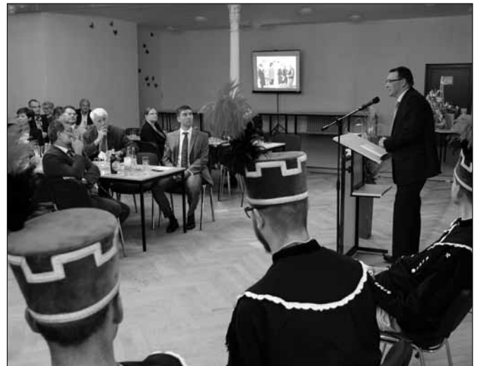
Festveranstaltung im Gasthof Tannenberg