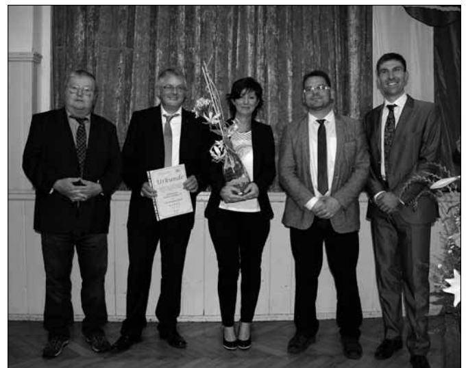
Übergabe Vereinspreis Annaberger Land 2016

Im Namen des Vereinsvorstandes ein herzliches „Glück Auf“