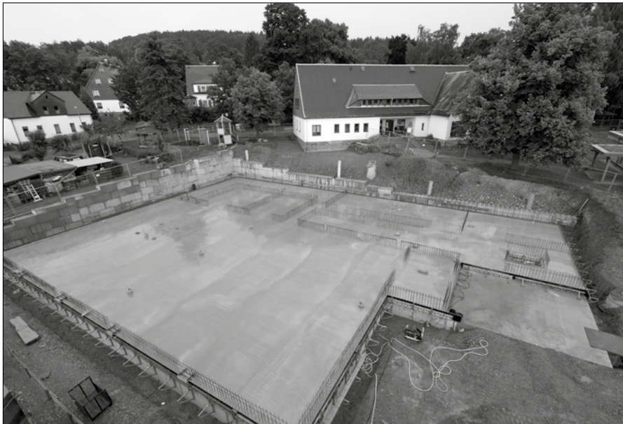
Fotos: Bodenplatte Bildungs- und Begegnungsstätte