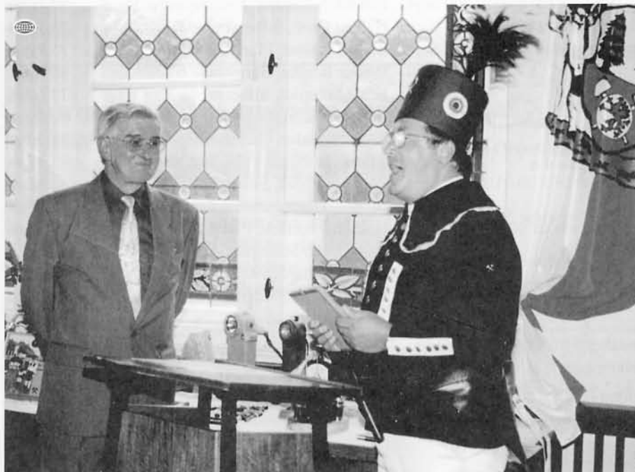
Gründung der Bergknapp- und Brüderschaft Oberscheibe / Scheibenberg