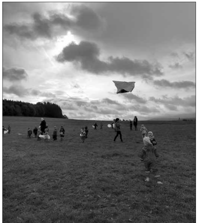
Text: Daniela Maiwald-Schubert

Am 11. Oktober hieß es: „Wind, Wind- Wind Wind, ein fröhlicher Gesell.“ Es gingen die Mäuse, Käfer, Teddys und Schmetterlinge aufs große Feld zum Drachensteigen. Die Kinder hatten Riesenspaß, weil wir sogar aus Mülltüten Drachen gebaut haben. Die Kinder hatten große Freude, mit den Drachen und den Tüten übers Feld zu rennen und alles gut festzuhalten, da ein starker Wind wehte.