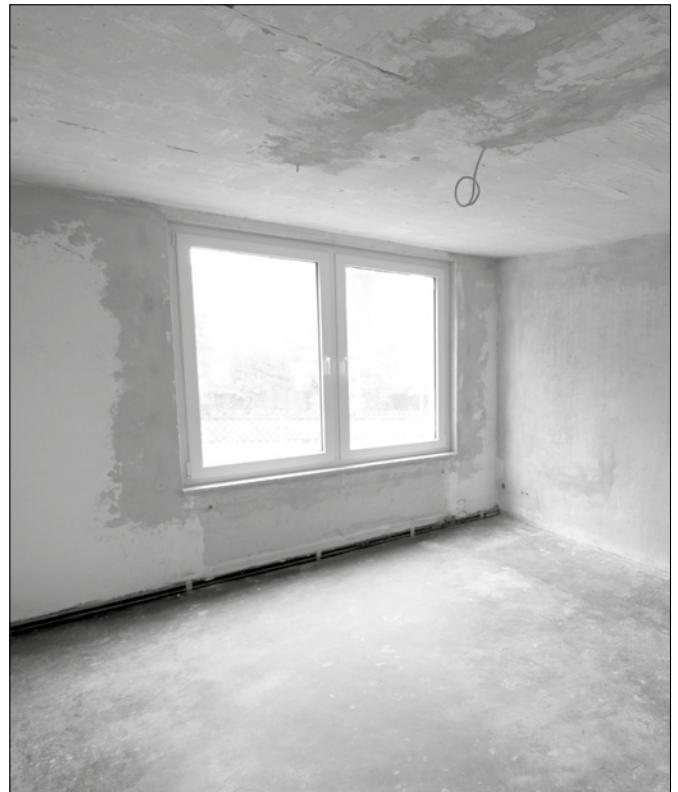
Sanierung Wohnung Crottendorfer Straße 7