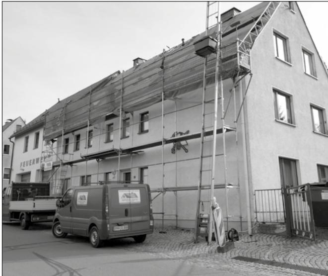
Erneuerung Dacheindeckung Feuerwehrgerätehaus Wohngebäudeteil Straßenseite