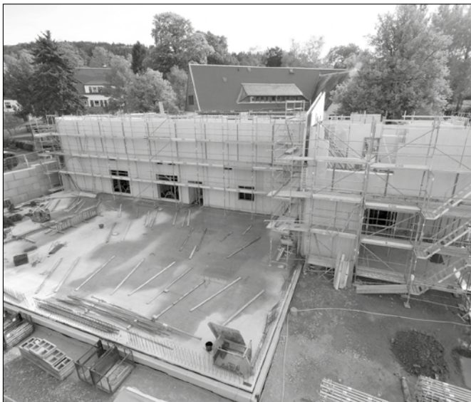
Bildungs- und Begegnungsstätte