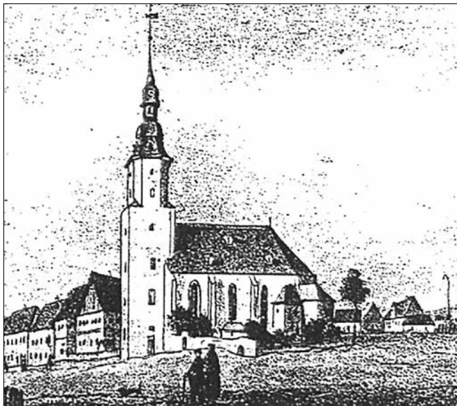
Die Johanneskirche zu Scheibenberg um 1839 mit einem Teil des alten Kirchhofes (rechts).