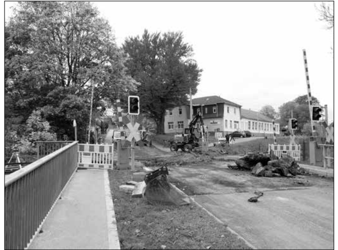
Erneuerung Bahnübergang B 101 in Schlettau mit Erneuerung Fahrbahndecke B 101 Schlettau-Scheibenberg