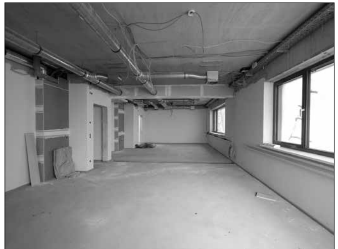
Errichtung Bildungs- und Begegnungsstätte