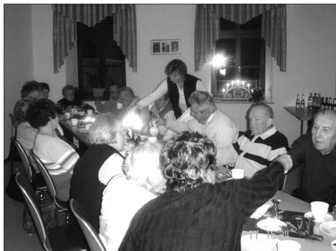
Adventstreff Seniorenkreis Oberscheibe 16. Dezember 2008

Hier finden Sie das Amtsblatt im Internet.