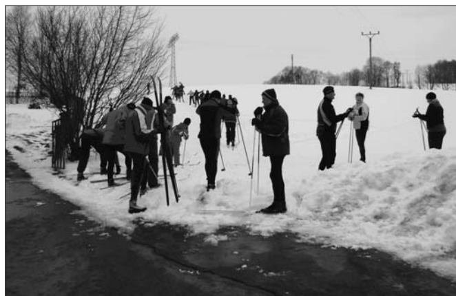
.. und jetzt geht's los!