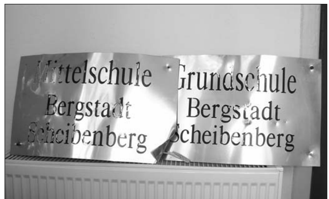
... beschädigte Schilder an unseren Christian-Lehmann-Schulen

Ebenso nicht nachvollziehbar bleiben mutwillige Beschädigungen an öffentlichen Einrichtungen, die ebenfalls kommunale Mittel verschlingen. So wurden zum Beispiel in der Silvesternacht die Namensschilder an unseren beiden Schulen regelrecht weggesprengt und Glasscheiben am Buswartehäuschen zerschlagen.