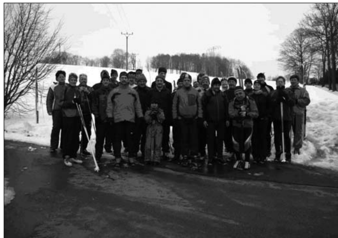
Vor dem Start an der Fiedler-Brauerei