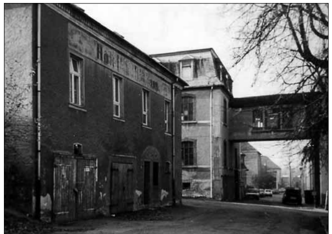
Bilder aus dem Jahr 1990