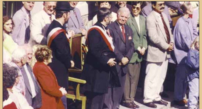
Mit Kurt Biedenkopf zur 475-Jahr-Feier 1997