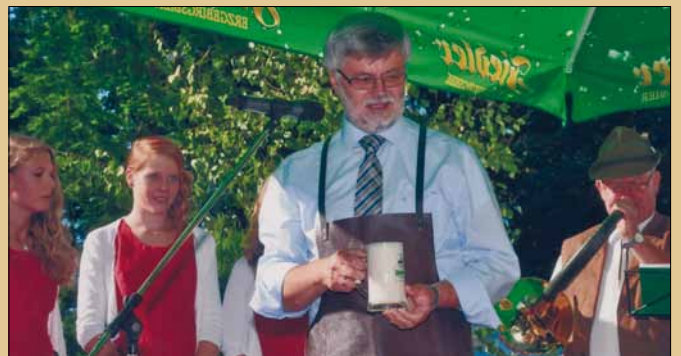
Bieranstich zum großen Bergfest 2013