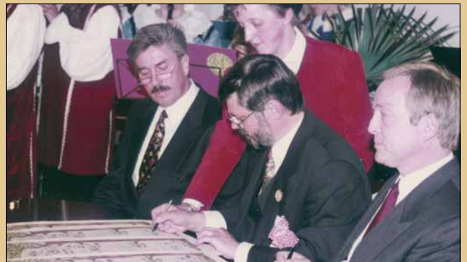
Partnerschafts-Unterzeichnung mit Simmelsdorf und Gundelfingen